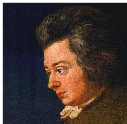
Joseph Lange, Retrato inacabado de Mozart a la edad de 26 años, 1782.

Original para violín, viola solistas y orquesta la Sinfonía concertante se inicia con un plácido y señorial Allegro maestoso . Aquí el compositor engalana el primer tema de esta forma sonata con numerosos recursos ornamentales, siguiendo el gusto francés en la utilización de broderies : mínimos y precisos adornos como breves trinos, apoyaturas, mordentes, entre otros. En ese marco orquestal surge el solo del violín y la viola que dialogan en fluido dinamismo con el grupo instrumental. Mozart deparó a la viola, instrumento que él mismo interpretaba con maestría al ofrecer conciertos de obras de cámara para cuerdas, algunos de los momentos más íntimos y encomiables del desarrollo de este primer movimiento.